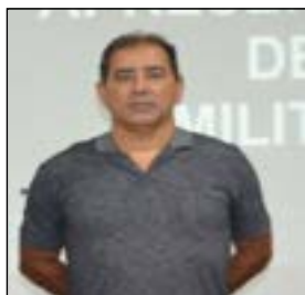
S Ten PTTC EDNEI DE PINHO ALMEIDA