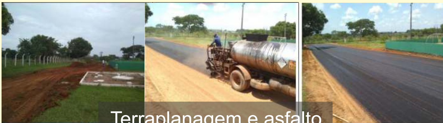
Terraplanagem e asfalto

No primeiro semestre deste ano foi realizada uma parceria com a Prefeitura Municipal e a comunidade de Colíder, município localizado no interior do Mato Grosso, propiciando que o Tiro de Guerra 09/003 executasse obras no Pátio de Formaturas Marechal Rondon.